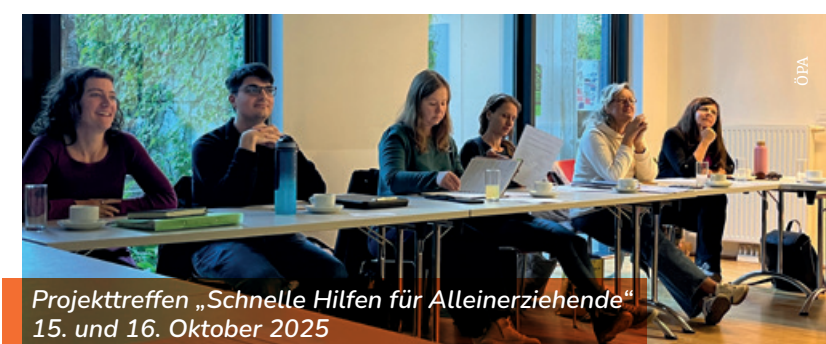
Projekttreffen „Schnelle Hilfen für Alleinerziehende“ 15. und 16. Oktober 2025