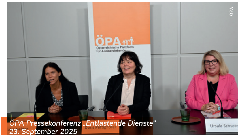
ÖPA Pressekonferenz „Entlastende Dienste“ 23. September 2025

Die Klausur am 17. November war ganz der Demokratie und ihren verschiedenen Aspekten im Zusammenhang mit unserer Arbeit für Alleinerziehende gewidmet. Wir schafften Bewusstsein, welche Instrumente wir nutzen können und wie wir Alleinerziehende und auch uns selbst stärken können. Aber auch wie wichtig Zivilgesellschaft für den Erhalt der Demokratie ist. Gemeinsam schmiedeten wir bereits erste Ideen für Partizipation und Empowerment und starteten mit einem kraftvollen Paket in das neue Arbeitsjahr.